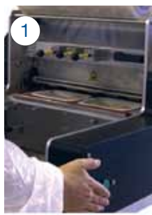
1- Mode automatique : Déclenchement du tiroir par impulsion.