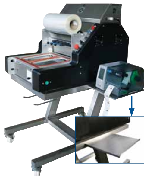
Châssis en aluminium anodisé, carter en inox et capot en ABS (version inox).