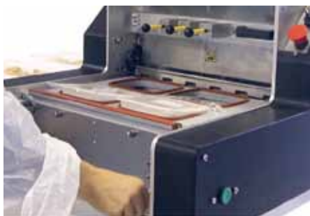
Système de relevage des barquettes en fin de cycle.