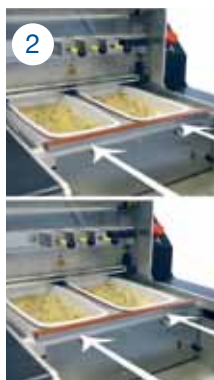
2- Mode automatique start : Déclenchement par détection de la barquette.