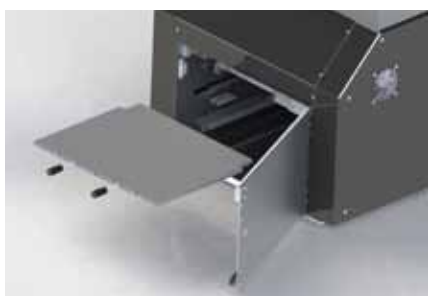
Plaques de scellages amovibles sans outil.