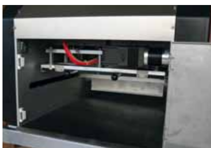
Accès facile pour le nettoyage et la maintenance à l'arrière de la machine.