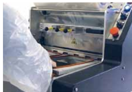
Changement des outillages simple et rapide. Mise en place simple et rapide de la bobine en façade.